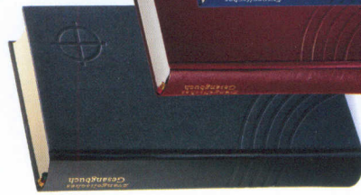
Großdruck- ausgabe Econolin

Econolin (schwarz): € 24,90 Neuaufgabe Januar 2014 Bestellnummer: 2062